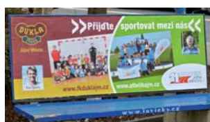
Dotace utrácí za sebeprezentaci