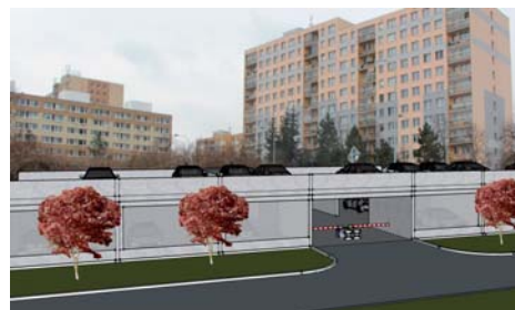
Model lehkého zkapacitněného parkoviště v ul. Hněvkovského/ Prašná

Se zkapacitněním parkovišť by mělo přijít opatření, které zabrání využívání našich parkovišť jako P+R pro mimopražské řidiče.