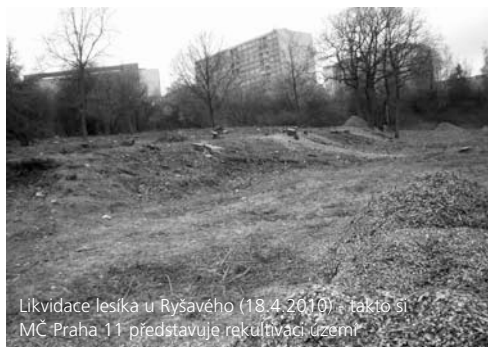
Likvidace lesíka u Ryšavého (18.4.2010) - faktó si MČ Praha 11 představuje rekultivaci území

V souvislosti s probíhající změnou územního plánu ze zeleně na zástavbu v rámci záměru Velké Roztyly začalo z jara podél ulice Ryšavého nad stanicí metra Roztyly na pozemcích firmy Alborg-Development, a.s. rozsáhlé kácení keřů i vzrostlých stromů. Kácení probíhá mimo období vegetačního klidu, dochází tedy k ničení nejen kvetoucích stromů, ale i ptačích hnízd a čerstvě vyvedených mláďat ptáků, zajíců a jiných živočichů! Čtvrtina území byla vykácena bez dendrologického posudku. Na území se kromě