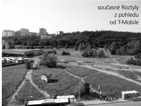
současné Roztily z pohledu od T-Mobile