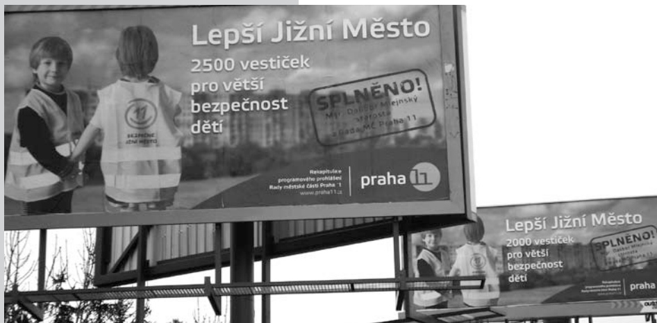
ul. Turkova, Praha 11