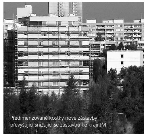
Předimenzované kostky nové zástavby převyšující snižující se zástavbu ke kraji JM

Náš názor: OS Hezké Jižní Město vzniklo před pěti lety, aby bránilo tomuto naprosto šílenému