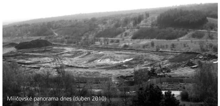
Milíčovské panorama dnes (duben 2010)