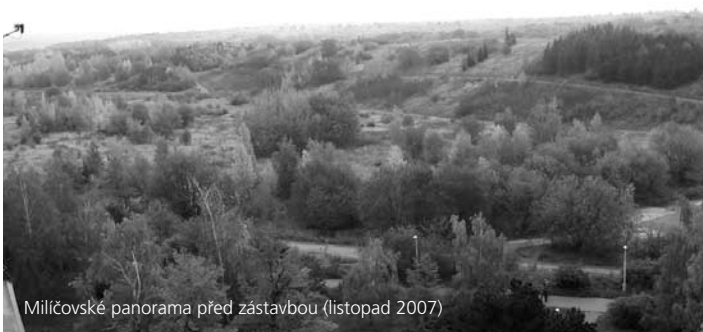
Milíčovské panorama před zástavbou (listopad 2007)

členka zastupitelstva MČ Praha 11, členka výboru občanského sdružení Hezké Jižní Město