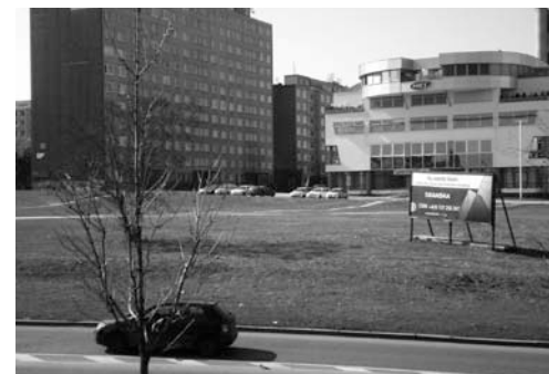
10.4.2010 - Chodov, Praha 11